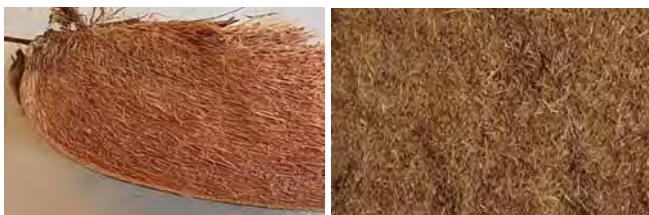
Figuur 1: Vezels van kokosnootbolsters

Kokosnoot bolsters (zie figuur 1) zijn ruimschoots voorhanden in alle tropische landen als goedkoop bijproduct van de kokosolie industrie. De vezelige bolster bestaat voor circa 30 % uit vezels en voor 70 % uit lignine-rijk merg.