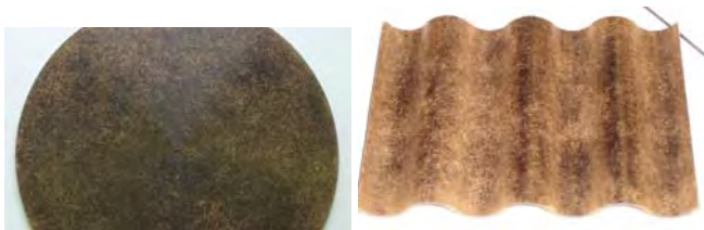
Figuur 2: Plaatmateriaal gemaakt van kokosvezels

Door gebruik te maken van de specifieke lijmeigenschappen van lignine in het merg en de sterkte van de kokosvezel kunnen zeer sterke platen worden gemaakt van hoge kwaliteit. Uitsluitend door heet persen van het gemalen bolster materiaal wordt de lignine uitgehard zonder toevoeging van chemicaliën (figuur 2). Op deze wijze kan tot op heden onderbenutte biomassa worden omgezet in een waardevolle grondstof voor de productie van een duurzaam houtvrij bouw materiaal.