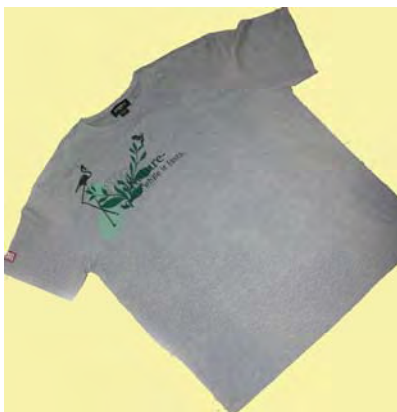
Een t-shirt van PLA-vezels

PLA kan door middel van (sheet)extrusie worden geëxtrudeerd tot folie. Uit deze folies kunnen vervolgens met dieptrekken vormdelen gevormd worden (thermoforming). Dunne films voor de productie van bijvoorbeeld zakken kunnen worden gemaakt via folieblazen. Van PLA kan verder, net als bijvoorbeeld van PET, een fles worden geblazen. Het materiaal kan ook worden geschuimd. Daarnaast kan PLA goed worden verwerkt tot vezels (wovens en non-wovens). De huidige productie-capaciteit van polymelkzuur is ongeveer 140 kton per jaar, de prijs van het granulaat is circa 1,5 à 2,5 €/kg.