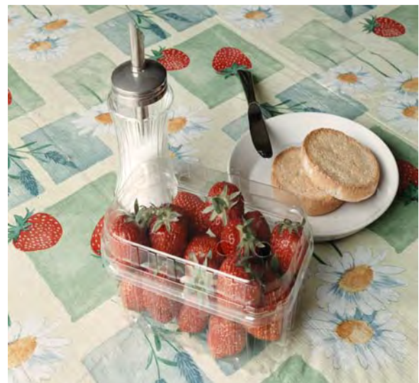
Aardbeienbakje voor biologische aardbeien, gemaakt van polymelkzuur.